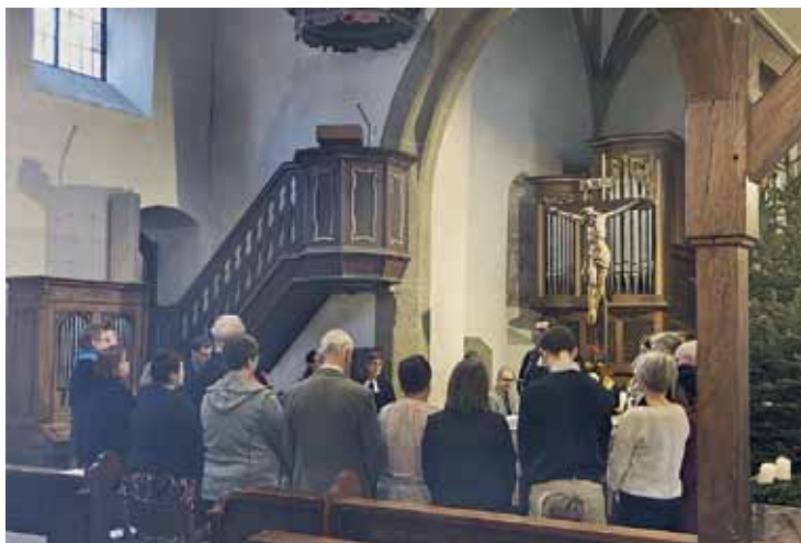
Verpflichtung und Einführung im Festgottesdienst am 21.12.2026